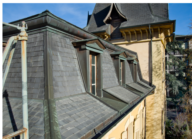
Détail toiture sud, 2013