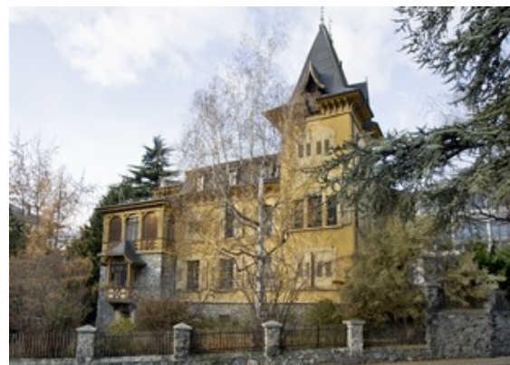
Vue du Sud