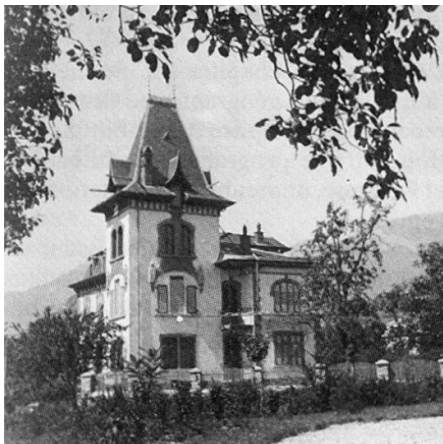
Vue de l'est depuis les jardins du Grand-Hôtel, vers 1900

Catherine RAEMY-BERTHOD, Inventaire Suisse d'Architecture 1850-1920 . Sion, volume 9, Société d'Histoire de l'Art en Suisse, Berne, 2003, p. 70 Claire EGGS-DEBIDOUR, Dominique STUDER, Liste des bâtiments extra-muros , 1988 Evaluation patrimoniale "Maison des Mayennets", SBMA, 2014 Presse: Gazette de Lausanne , 23.11.1937, p.2 ; Journal de Genève , 03.01.1894 p.2-3 ; Le Nouvelliste , 11.06.1938; Le Nouvelliste , 04.11.1931 ; Journal et feuille d'avis du Valais , 05.06.1946 ; Briger Anzeiger , 25.09.1956 p.3. Sedunum Nostrum, « Sion 1900: arrêtons le massacre ! 10 ans de joyeuses démolitions... », Bulletin n°38, 1986 Sedunum Nostrum, « De la disparition des jardins au jardin des disparus », Bulletin n°77, 2006. Sion 1850-1920 , Dépliant de la série "Découvrir le patrimoine", Sedunum Nostrum & Patrimoine suisse, 2013. SIP Archives, MH 136/3083, Nicola GAMMALDI (Atelier Saint-Dismas SA), Rapport de sondages, appartement 3e et 4e étages, Maison les Mayennets, Rue des Cèdres, Sion, 10.06.2018 (rapport non publié).