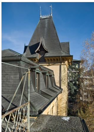
Détail toiture, sud, 2013