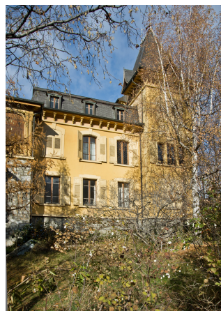
Façade sud, 2013