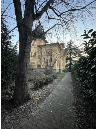
Vue depuis le portail d'entrée, 2023