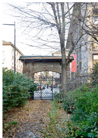
Portail, 2013