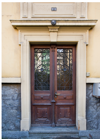
Porte d'entrée, nord, 2013