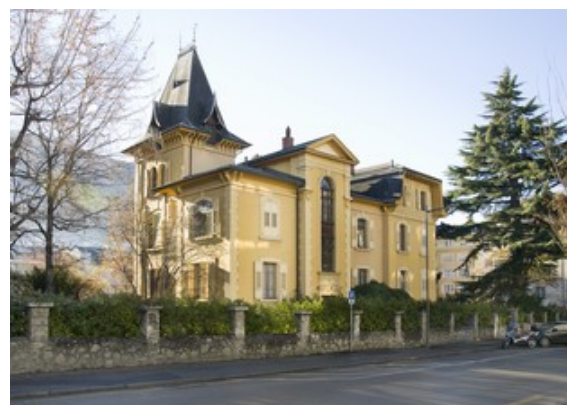
Vue du Nord

Cette villa témoigne d'une tendance dans l'architecture privée à Sion, dès 1895, à la diversification du langage architectural et la complexification de l'ornementation. Associant divers renvois de styles et d'époques, prenant notamment modèle sur des traditions étrangères à la région, mettant en scène des jeux de volumes et de toitures, une variété de percements, de matériaux - comme la brique, non locale - et une richesse du décor en façade, la Villa des Cèdres est un rare témoin de villa de style éclectique et la première du genre construite à Sion. Elle a une parenté stylistique avec la Villa Closuit à Martigny, construite à la même date par le même bureau. Elle s'inscrit dans un essor de l'architecture éclectique pour l'habitat bourgeois en Europe et en Suisse entre la fin du XIXe et le début du XXe siècle. Bon état de conservation, extérieur et intérieur, témoin rare d'éléments architecturaux Art nouveau en Valais. Sa valeur de situation est importante : rare témoin de villa urbaine construite conformément au plan d'extension de 1897, elle conserve son jardin historique avec lequel elle forme un îlot arborisé préservé au milieu d'un environnement bâti densifié depuis les années 1950. Elle appartient au patrimoine architectural Belle Epoque de la ville de Sion.