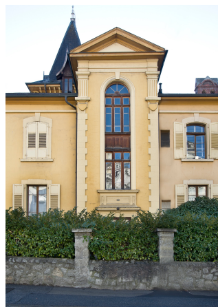
Détail cage d'escalier nord, 2013