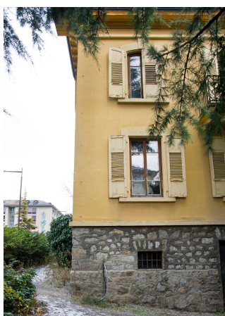
Détail façade ouest, 2013