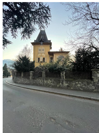
Vue de l'est, 2023