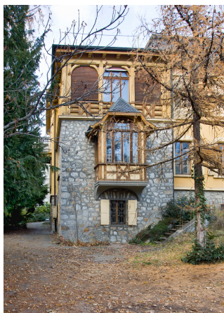
Annexe 1910-11 vue du sud, 2013