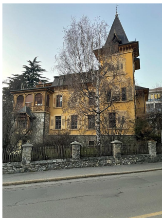
Façade sud, 2023