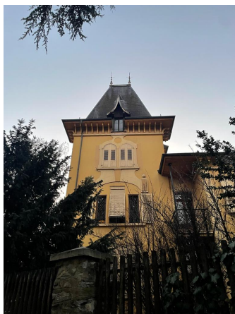
Détail tour, 2023