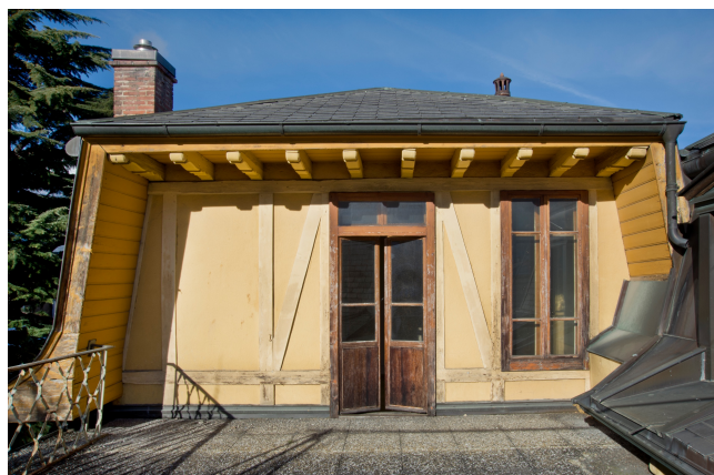
Annexe ouest, terrasse, 2013