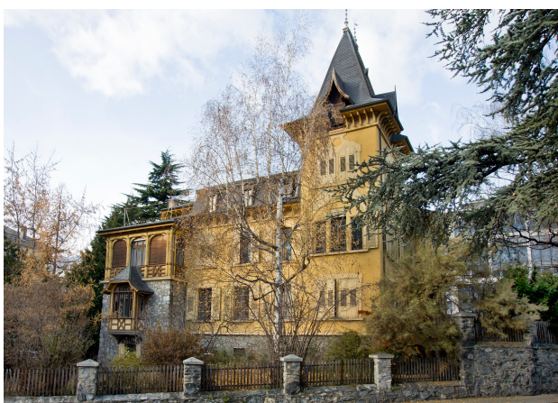
Vue du sud, 2013