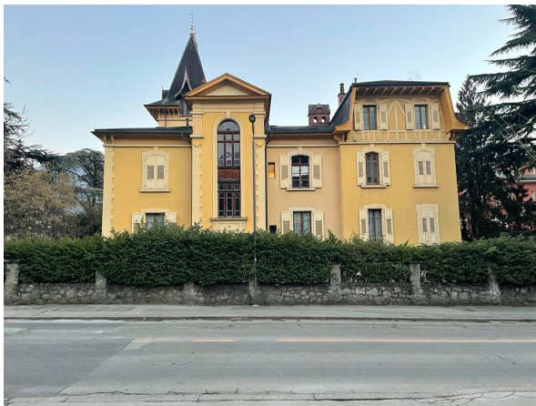
Façade nord, 2023