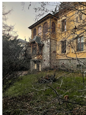
Façade sud, 2023