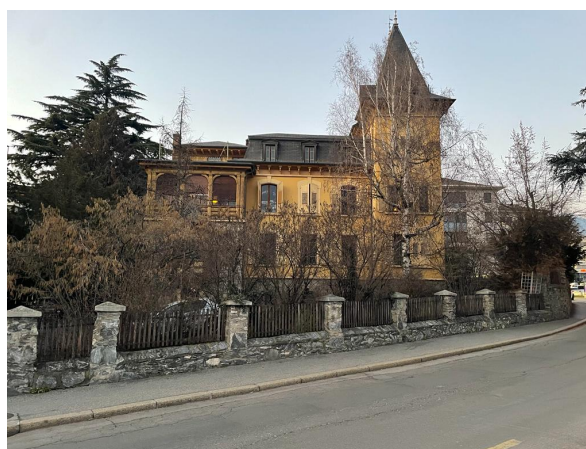
Vue du sud, 2023