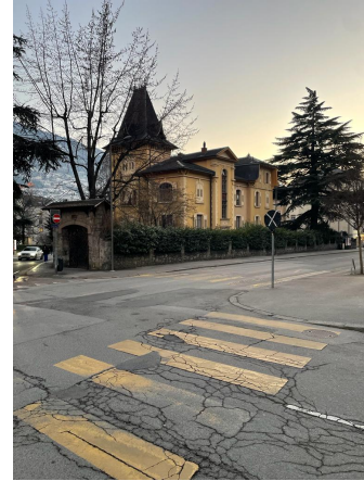
Vue du nord-est, 2023